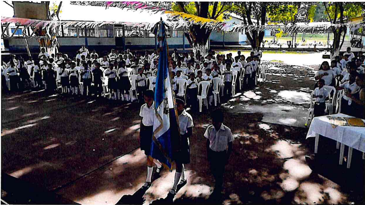
Acto de inauguración a la actividad realizada en EOUM 15 de septiembre JM, Barrio El Centro, La Libertad, donde se realizó el juramento a la bandera y se cantó el himno nacional de Guatemala.