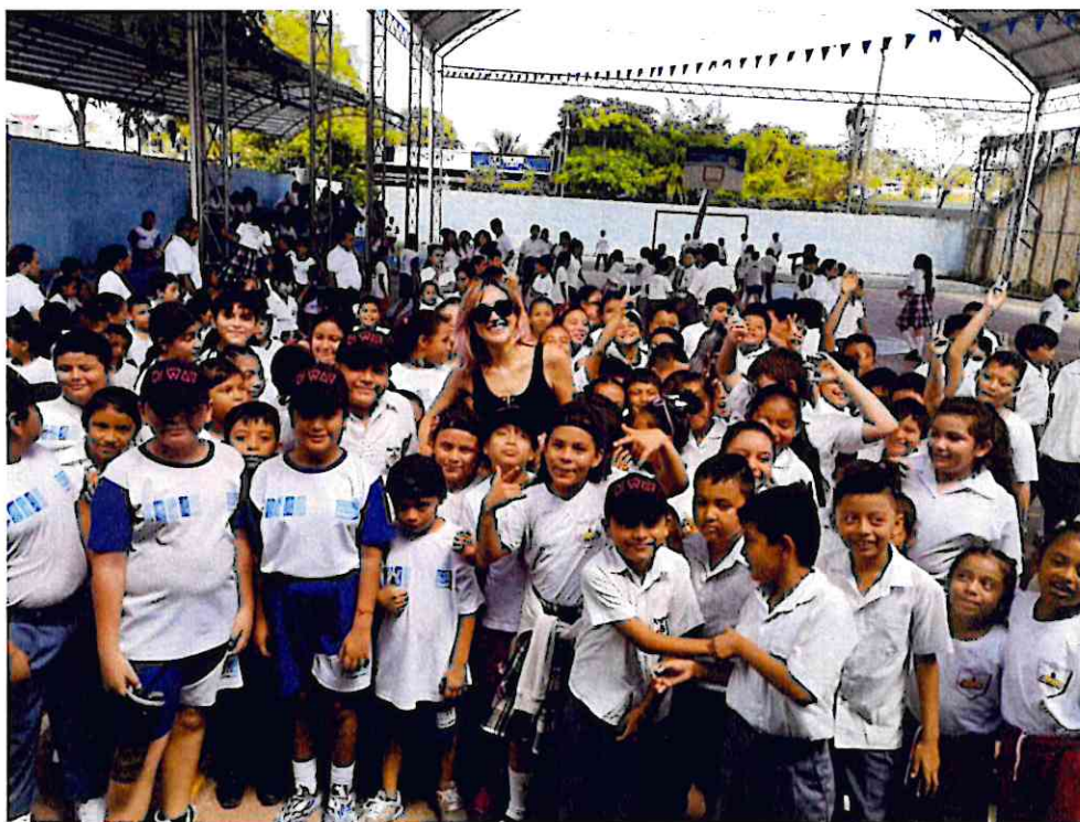
Momento de convivencia con los estudiantes de EOUM JM Tipo Federación "José Benitez Gómez" Aldea Santa Elena de la Cruz, Flores, Petén al terminar la actividad.