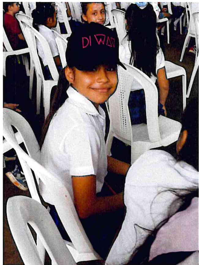
Una estudiante de EOUM 15 de septiembre JM, Barrio El Centro, La Libertad, ganadora de una gorra en la rifa