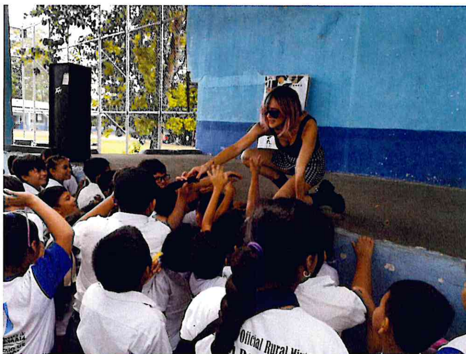
Integrando a los estudiantes durante mi presentación en EOUM JM Tipo Federación "José Benitez Gómez" Aldea Santa Elena de la Cruz, Flores, Petén al terminar la actividad.